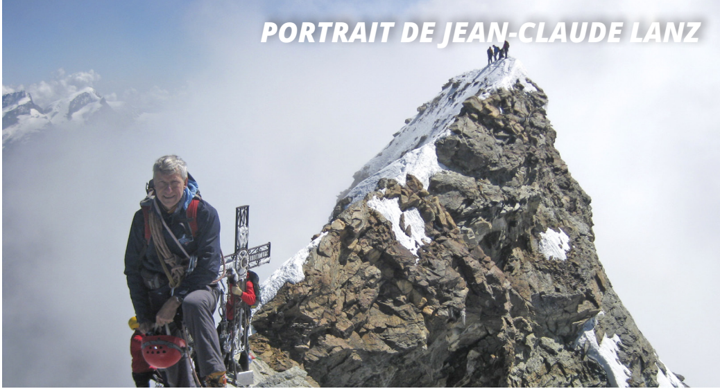
Le Cervin en 2011