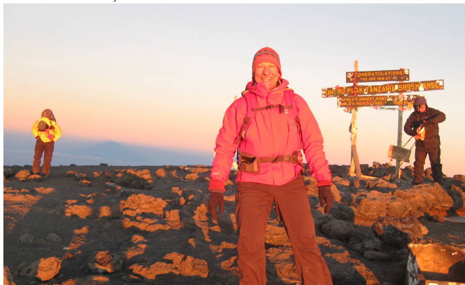
Le sommet du Kilimandjaro au lever du Soleil