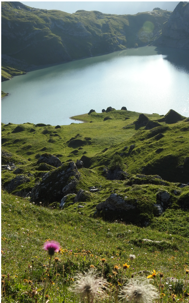
Iffigsee en montant à la Wildhornhütte